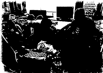
赤ちゃんが遊びにきました♪