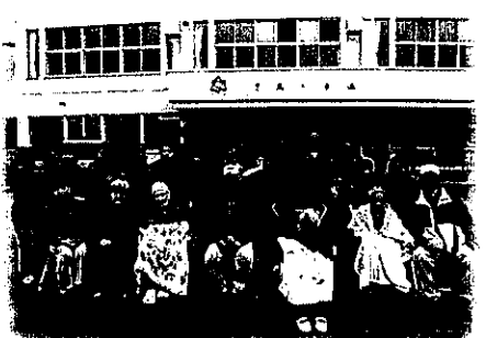
占冠中学校の体育祭総練習