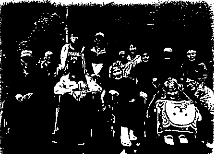
日高神社周辺にて記念撮影♪