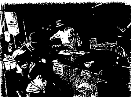
山菜市にお出かけしました！