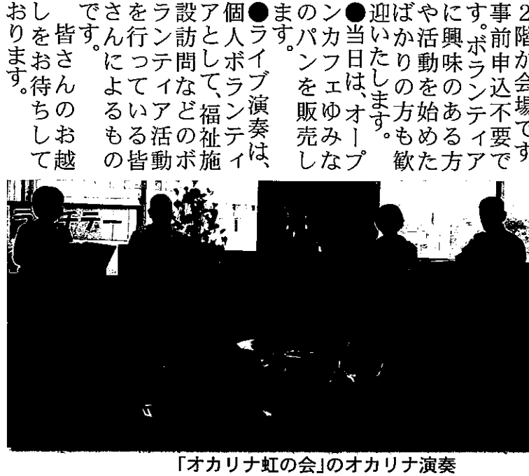
「オカリナ虹の会」のオカリナ演奏

●開催時間は12時～13時、千歳市社会福祉協議会2階が会場です。 事前申込不要です。ボランティアに興味のある方や活動を始めたばかりの方も歓迎いたします。 ●当日は、オープンカフェゆみなパンを販売します。 ●ライブ演奏は、個人ボランティアアとして、福祉施設訪問などのボランティア活動を行っている皆さんによるものです。 皆さんのお越しをお待ちしております。