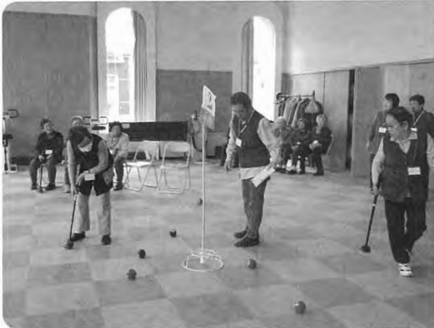
ナイスショット 室内パークゴルフ