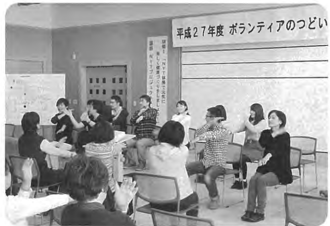
ボランティアのつどい