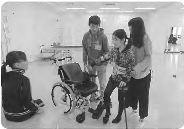
福祉ワークキャンプ 体験学習