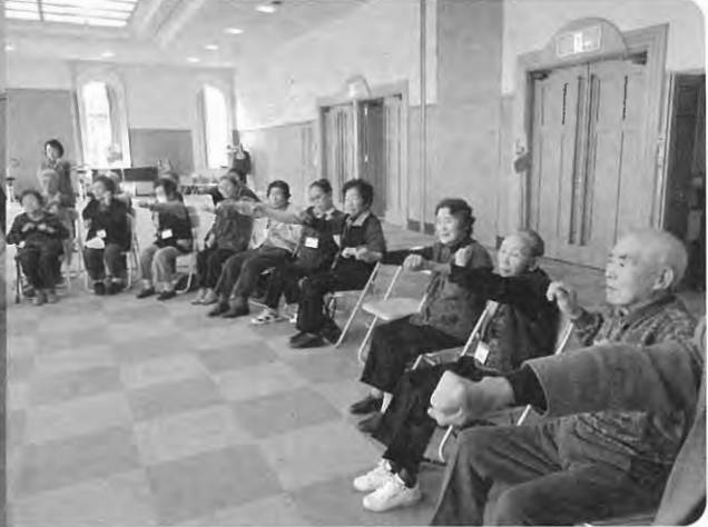
みんなで体操 体も心もほぐれます