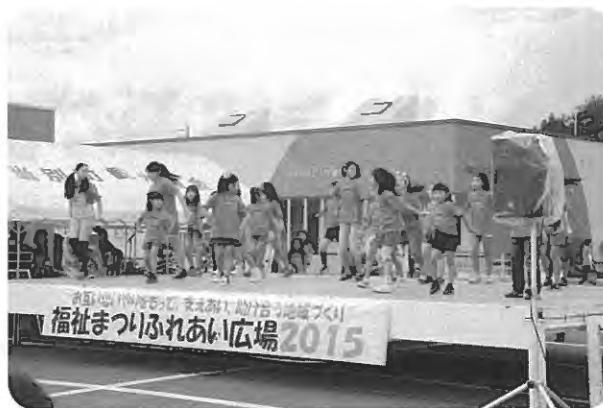
福祉まつりふれあい広場