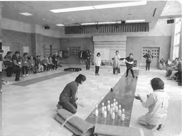
室内ゲーム 体が自然に動き出します