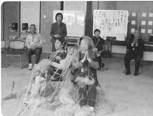
恒例の誕生日会 みんなでお祝いします