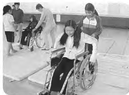
福祉教育 高齢者疑似体験

当社協としても、これまで進めてきた「地域福祉の推進」からその取組みに寄与できる部分が多く、またすでにボランティアセンターを運営し広く地域にネットワークを有していることから、生活支援サービスの充実やコーディネーター役など積極的に中核的な役割を担っていきたいと考えております。