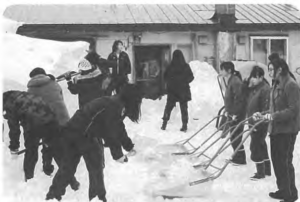
当別高校 除雪ボランティア