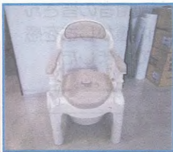
ポータブルトイレ