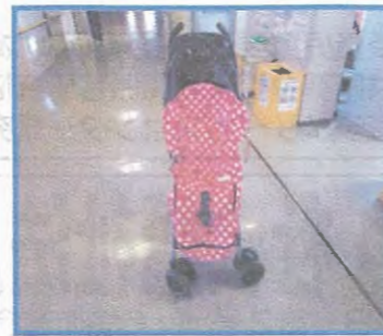
ベビーカーカバー