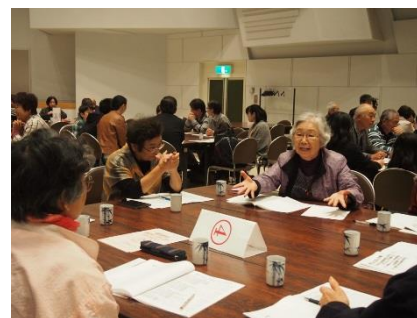
▲ 阿寒町ボランティアのつどい