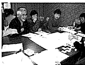
熱心にグループで話し合う参加者の皆さん

空知管内のボランティア研修会として200名の参加があり、美唄からは町内会、民生委員、地域福祉委員、ボランティアなど60名が参加しました。研修開始前には、美唄市赤十字奉仕団の皆さんにご協力いただき緊急・災害用煮炊釜(直径90cm)を使った約160食のかぼちゃ汁が振舞われました。