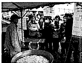
緊急・災害用煮炊釜(手前)を見学する参加者