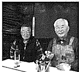
開店準備もおわり安堵の「パーテンドー」?