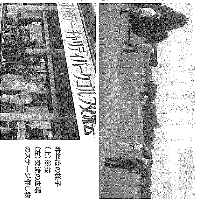
昨年産の様子 (上) 競技 (左) 交流の広場のスチーゾ催し物

◆お申込み方法 千歳市社会福祉協議会又はリバーサイドパークゴルフ場へ参加費を添えてお申込み願います。 ◆問い合わせ先 総務課総務係 電話 0123 (27) 2525 ◆申込み締切日 8月20日(木)