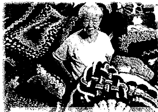
手編みで作られた沢山の座布団

この度(幾寅のデイサービスゆうゆう・金山のデイサービスかなつぶ)にプレゼントしていただきました。 心よりお礼申し上げ大切に使用させていただきます。ありがとうございました。