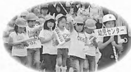
幼児センター年長組

開拓の歴史をしのぶ事業として、平和と開拓の礎碑前で東川町戦没者並びに開拓功労者慰霊追悼式が厳かに行われ、幾度かの戦役で尊い命を捧げられました戦没者213柱の御霊と郷土東川町の開拓に精魂をかたむけられました先人功労者249柱の御霊に対し黙祷をささげ、松岡町長、北海道知事代理、北海道連合遺族会会長代理からそれぞれ追悼のことばが述べられ、参列者全員により献花し冥福をお祈りいたしました。