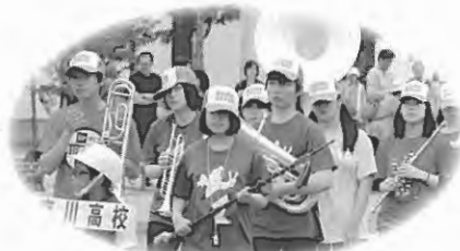
吹奏楽同好会（東川高等学校）