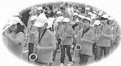
スクールバンド（東川小学校）