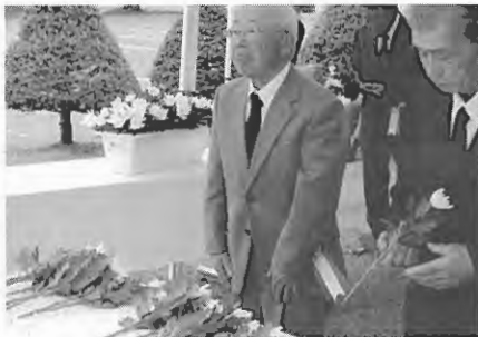
参列者による献花