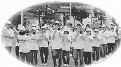
吹奏楽部（東川中学校）