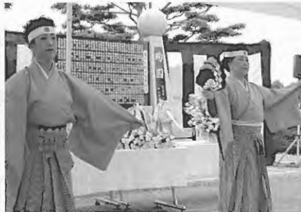
岳加代会による奉納の舞