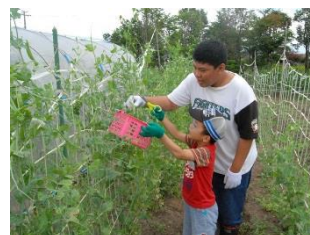
▲ 夏のボランティア体験・職業体験