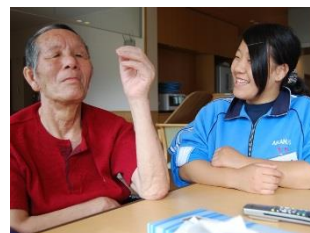
▲ ワークキャンプ事業