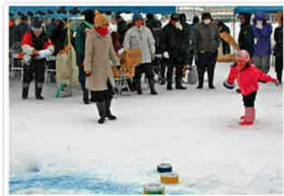
このカーリングから将来の五輪選手が?