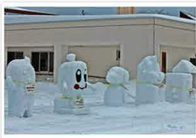
雪像タイトルも強風のためヒモで結んでいます