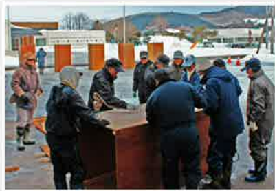
雪柱枠の作成はボランティア交友会です