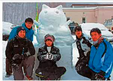
今年の高校生の雪像は上手だと評判でした