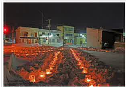
キャンドルナイトも風雪の中参加いただきました