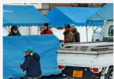
強風の中 準備に片付けにご苦労様でした