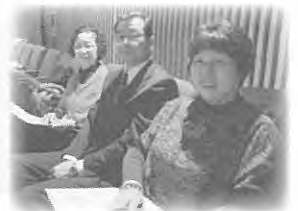
参加しました!(参加者の方々です。)