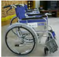
車イス（自走式・介助式）