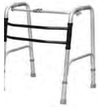
歩行器 （固定式・夕付付）