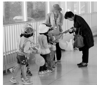
昨年のさくら保育園児による街頭募金