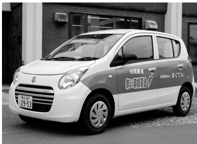
「社会福祉法人ほくてん北海点字図書館」へ車両購入費として助成