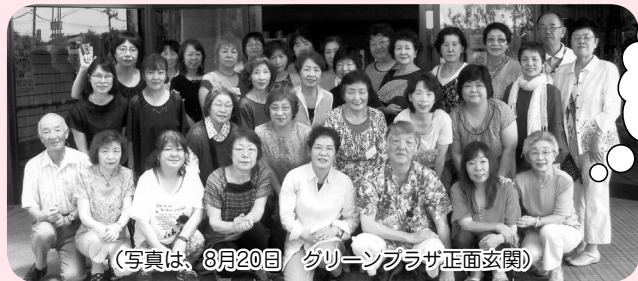
(写真は、8月20日/グリーンプラザ正面玄関)