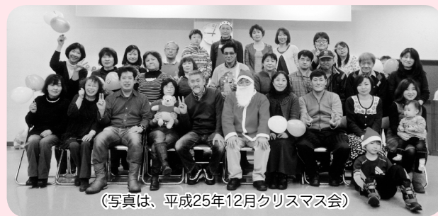
(写真は、平成25年12月クリスマス会)