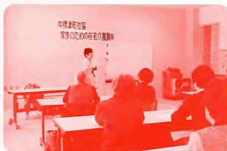
《家族のための在宅介護講座》