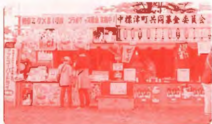
《募金額合計193,867円》 (うち販売益金98,814円)

に活用さ れていま す。 ご協力 下さいま した皆様、 本当にあ りがとう ございました。