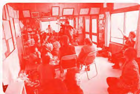
《ふれあいいきいきサロン活動の支援》

これらは「赤い羽根共同募金」を使わせていただき実施している事業、各種団体の活動の一例ですが、この他にも中標津町の福祉向上のために様々な活動を行っています。