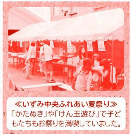
《いずみ中央ふれあい夏祭り》 「かたぬき」や「けん玉遊び」で子どもたちもお祭りを満喫していました。