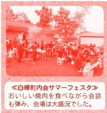
《白樺町内会サマーフェスタ》 おいしい焼肉を食べながら会話も弾み、会場は大盛況でした。