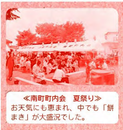
《南町町内会 夏祭り》 お天気にも恵まれ、中でも「餅まき」が大盛況でした。

7月下旬から8月にかけて、夏らしく暑い日が続いた中標津町ですが、町内の各町内会でも夏祭りなどたくさんさんのイベントが行われました。 その中からいくつかイベントの様子をお伝えします。