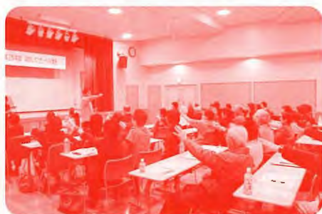
《福祉レクリエーション講座》