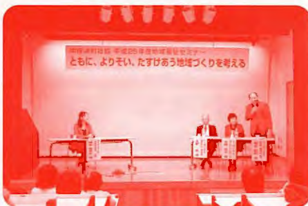
《地域福祉セミナー》