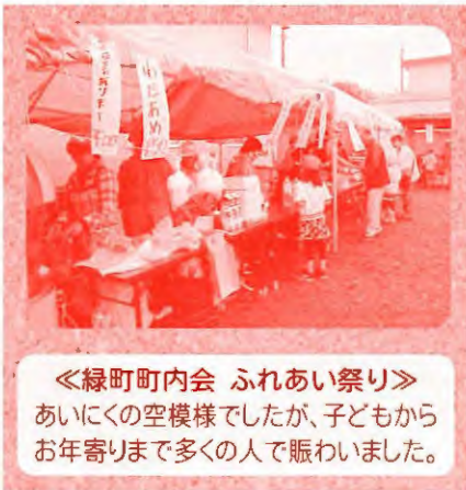
《緑町町内会 ふれあい祭り》 あいにくの空模様でしたが、子どもからお年寄りまで多くの人で賑わいました。