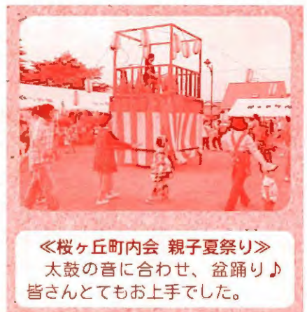
《桜ヶ丘町内会 親子夏祭り》 太鼓の音に合わせて、盆踊り♪皆さんとてもお上手でした。

各々の町内会のネーミングに特色があり、内容も、餅まきや昔遊びなど趣向を凝らし多くの方々が参加され楽しんでいました。また外の食事も一段と美味しく頂くことができ、皆さん笑顔でほおばっていました。 このような町内会のイベントを通じて、見守りやいざという時の助け合いのための関係づくりが、より深まっていくことと思いました。 また、中標津町社会福祉協議会では、町内会等身近な地域における日々の繋がりの大切さについて考えていただくための機会づくりを目的とした事業として、出前講座を実施しておりますので、町内会の皆様、是非お声かけください。