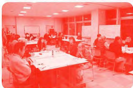
《地域福祉リーダー養成講座》