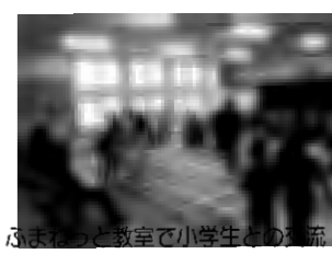
ふまねっと教室で小学生との交流