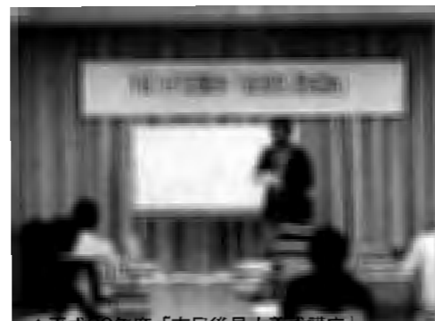
▲平成26年度「市民後見人養成講座」

当センターでは「市民後見人養成講座」を開催しています。今年度は39名の方が受講申込され、学習を進めております。昨年度までの市民後見人養成講座修了者の中には実際に市民後見人として活躍している方が多数おられます。市民後見人について興味のある方は下記連絡先までお気軽にお問い合わせください。