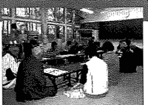
地域の団体・組織の打ち合わせ