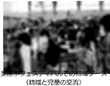
(地域と児童の交流)

現在、災害時に地域住民がどのように避難したらよいかの話し合いや避難訓練について協議が進められています。