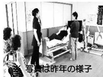
写真は昨年の様子

少子高齢社会で核家族化が進んでいます。家族で介護が必要な方々や今後介護を担わなければならない方々の介護に対する負担を軽減し、介護知識を習得することを目的とした「家族介護教室」を全4回の日程で開催します。第1回目は、福祉用具についての講座を予定しております。参加費は無料ですので、是非この機会にご参加をお待ちしております。