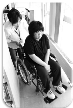
※ 写真は昨年の様子