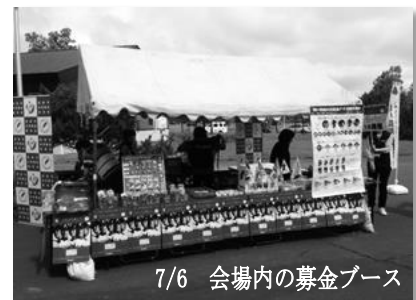
7/6 会場内の募金ブース

7月6日(日)に開催されたファイターズイースタン・リーグ公式戦(釧路市民球場)において、北海道日本ハムファイターズによる赤い羽根共募金活動支援の一環として、会場内での募金PR活動を行いました。会場内に設置の特設ブースで一定額の募金にご協力頂いた方にお礼として、オリジナルの「缶バッジ」や「ステッカー」、「フラッグ」、「サンバイザー」等を進呈する募金活動で、 161,959円 の募金協力がありました。今後は8月10日(日)に道内フットサルチームのエスポラーダ北海道の公式戦があり、そちらでも「缶バッジ」や「クリアファイル」での募金活動を予定しています。