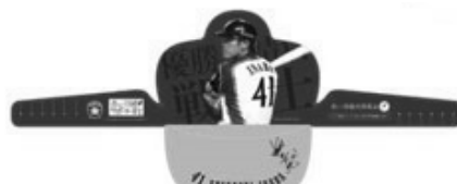
サンバイザー(100円) ※( )内は募金額