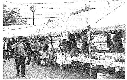
作品販売コーナー

焼きそば・タコ焼き・ジュースなどの飲食コーナー、衣類・工芸品などの作品販売コーナーにたくさんの方が集まっていました。学童ボランティアのみなさんも、頑張ってお手伝いをしていました。