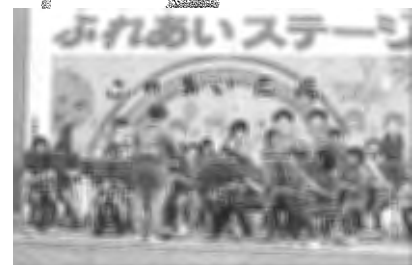
士別中学校吹奏楽