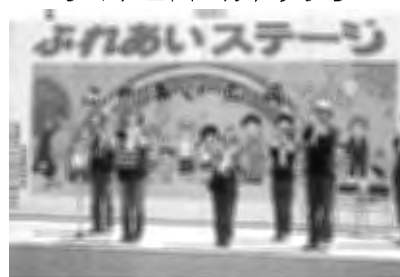
士別聴覚障がい者の会