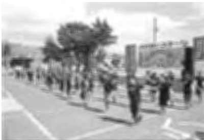
士別南小学校3年生

ステージでは踊りや一輪車、また吹奏楽やビンゴ大会など、さまざまな催し物があり、会場がひとつになって楽しい時間を過ごしていました。