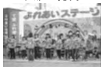
士別南中学校吹奏楽部