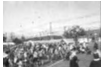
ふれあい もちまき