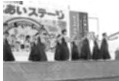
レイアロハ ルアナフラ