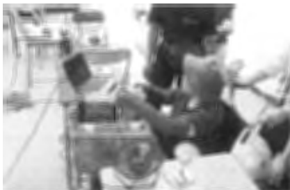
おもしろスポーツサイエンス