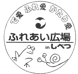
ふれあい広場シンボルマーク

開催日：平成26年7月5日～7月6日 開催場所：士別市総合体育館・駐車場 主催：社会福祉法人士別市社会福祉協議会 運営主体：ふれあい広場2014 in しべつ PART 31 実行委員会 共催：士別市 後援：士別市教育委員会、士別市共同募金委員会