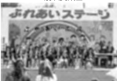
士別西小学校6年生