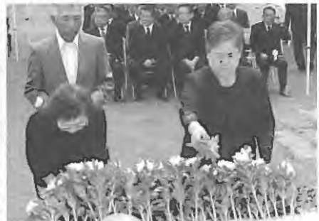
参列者による献花