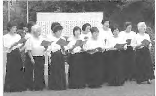
みずほコーラスによる奉納唄