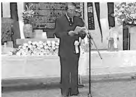
お礼の挨拶をする川上社協会長