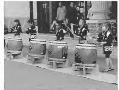
第一小学校「一小太鼓」

開拓の歴史をしのぶ事業として、平和と開拓の礎碑前で東川町戦没者並びに開拓功労者慰霊追悼式が厳かに行われ、幾度かの戦役で尊い命を捧げられました戦没者213柱の御霊と郷土東川町の開拓に精魂をかたむけられました先人功労者249柱の御霊に対し黙祷をささげ、松岡町長、北海道知事代理、北海道連合遺族会会長代理からそれぞれ追悼のことが述べられ、参列者全員により献花し冥福をお祈りいたしました。