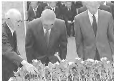
参列者による献花