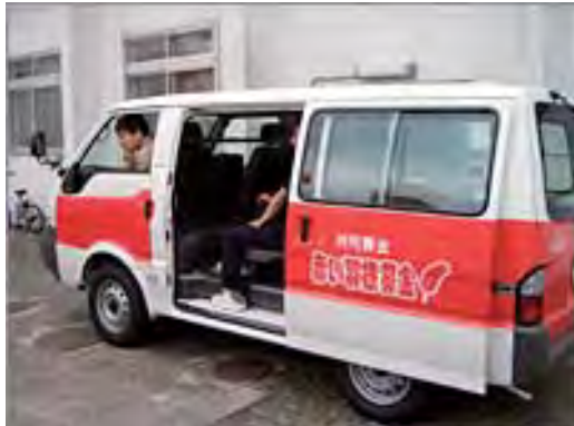
真新しい車両にご利用者も喜んでおります