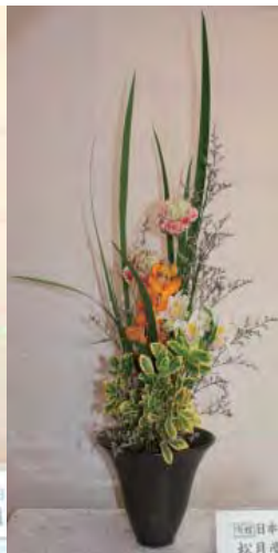
区南日本生花司 移月堂吉流

昨年からの老人福祉センターには生け花を楽しみに来る方が増えました。 この生け花は『日本生花司松月堂古流』のご婦人たちが、季節の花から珍しい花まで、ステキな花材の組合せで生けられています。ぜひ一度福祉センターに来てご覧になって下さい。