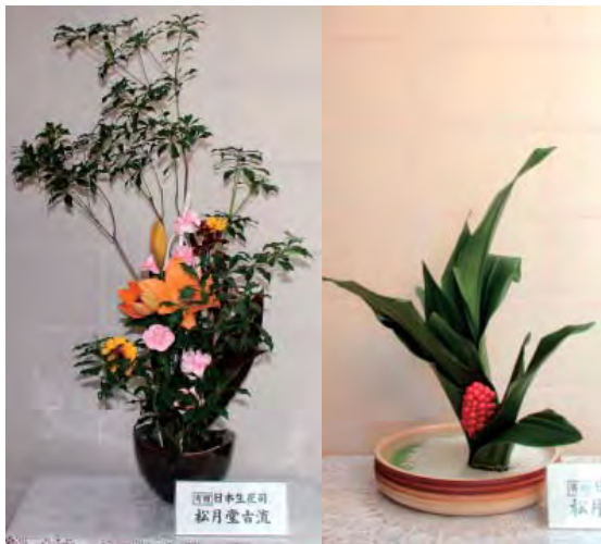
区南日本生花司 移月堂吉流

北海道共同募金会から平成25年度助成金事業として佐呂間町社会福祉協議会にリフト付きワゴン車を寄贈していただきました。 この車両は町内の人工透析患者の送迎、および車椅子やストレッチャ―利用者の病院送迎など、移送サービスで活用させていただきます。 ありがとうございます。