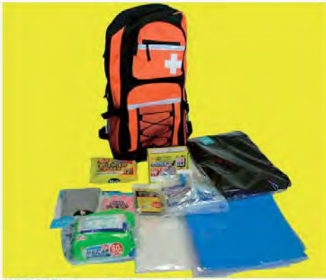
避難リュックセット