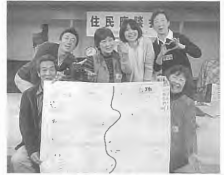
住民座談会のようす