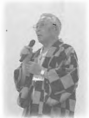
鉦路町老人クラブ連合会 第51回湯治運動 開会あいさつ。