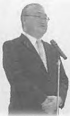
鉦路町長より ご祝辞を いただきました。