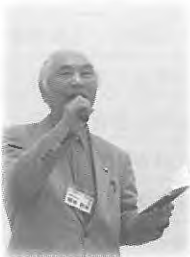
演芸大会に 参加しました