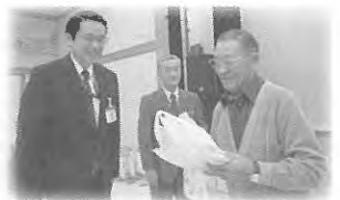
参加者男女最高年齢 のお二人です!