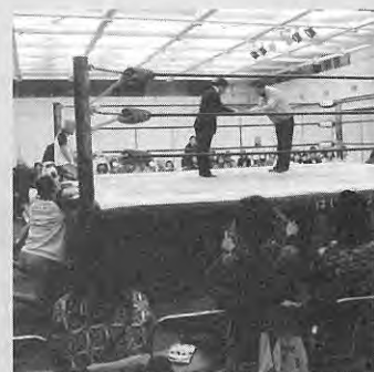
[上]池田商工会青年部から目録が手渡された