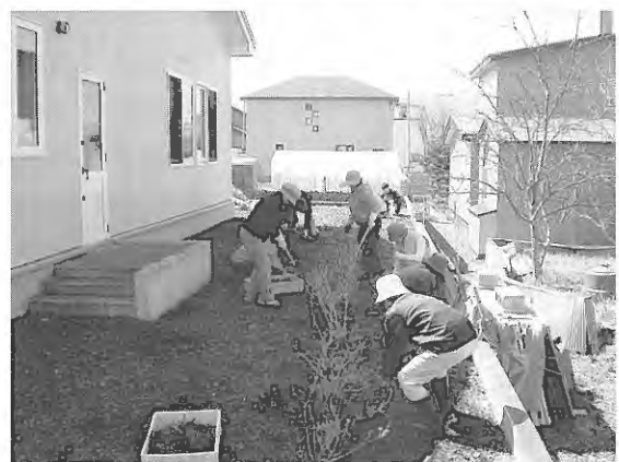
【上】手際良く作業に取り組む地域の皆さん