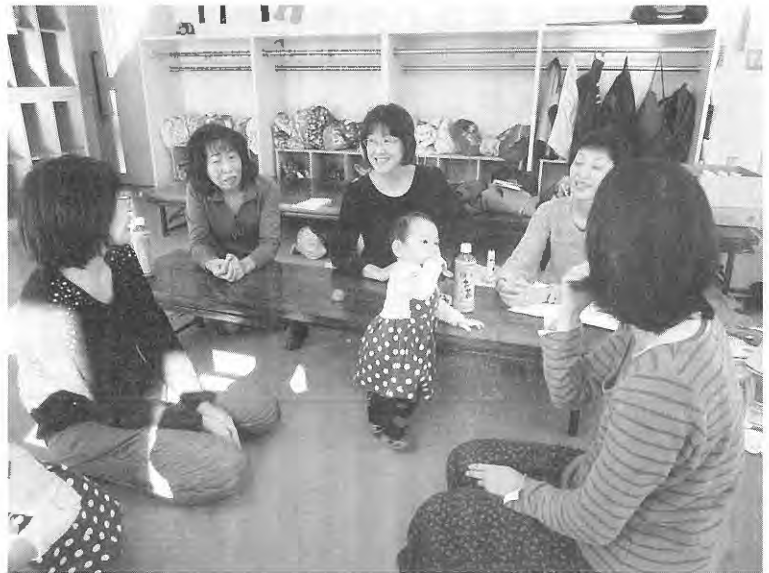
子育てを終えた世代が、若い世代を支援