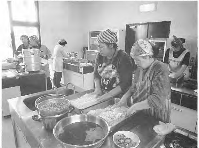
[上] 味噌造りの行程で、米こうじを加え丁寧に混ぜる参加者

昼食作りでは、昨年から1年かけて完成させた味噌をふんだんに使って、鮭のちゃんちゃん焼きや豚汁など、料理5品を作り、できあがった料理を食べながら、世間話で盛り上がり、楽しい講習会となりました。