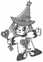
しゃっきーは厚岸町社協のシンボルキャラクター名です

平成25年度事業報告と決算報告 豊かさを実感できるまち実現と 地域福祉活動拠点の強化