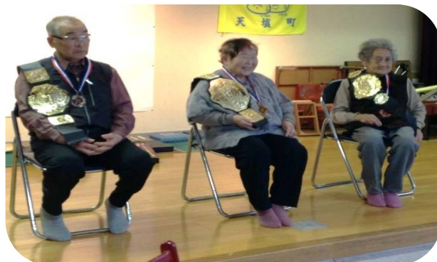
天塩地区サロン入賞者のみなさん