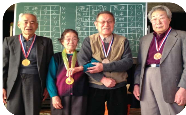
雄信内地区サロン入賞者のみなさん