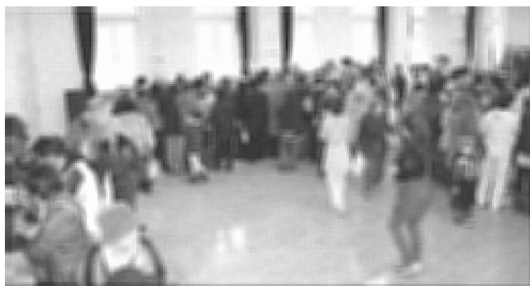
【H25.12.1 歳末たすけあいバザー】