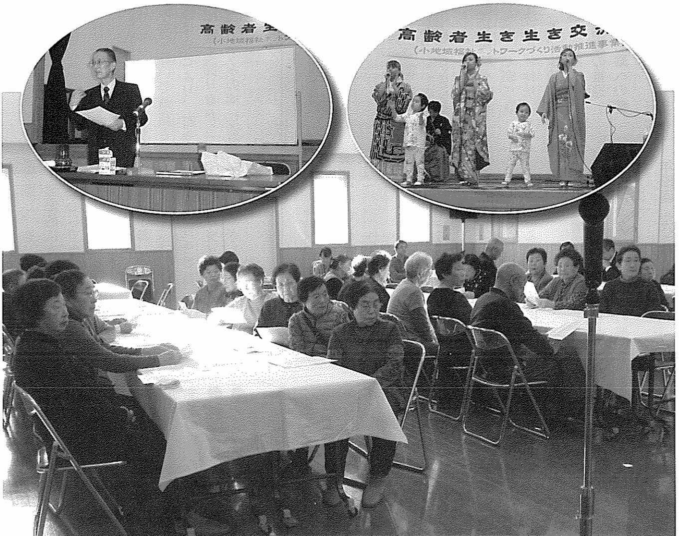
【H25.12.17 緑町2地区高齢者生き生き交流会】