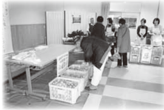
手をつなく親の会 玉ねぎ格安販売