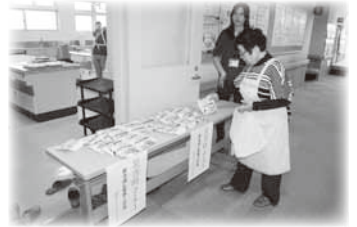
いちげの会 炊き出し試食