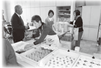
いつも満員のふれあい喫茶店