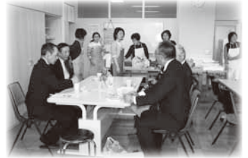
いちげの会 炊き出し試食