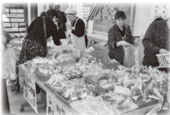
大人気の手づくりぱん販売 おんべつ学園