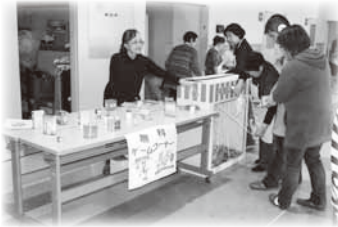
ふれあい無料コーナー