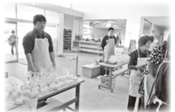
コミュニティ浦幌 手づくりローソク等販売

ボランティアさんをはじめ多くの方々のご協力をいただき、この広場の目的である『障がいをもつ人ももたない人もこの交流の場を通じて、社会参加を促進し、お互いを理解すること』が推進されました。