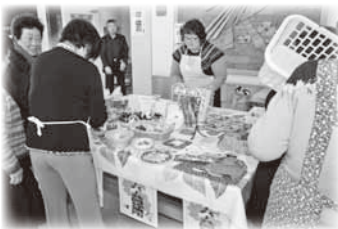
クロバー共同作業所 作品販売