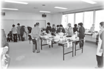
提供品盛りだくさんの友愛セール