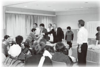
毎回大盛況になる おたのしみ抽選会