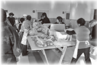
東北地方復興支援販売