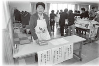
女性連 複十字募金コーナー