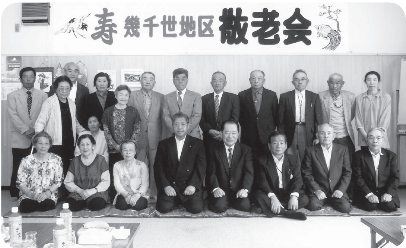
社協地域福祉活動推進事業（敬老会実施団体運営費助成）