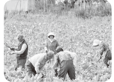
(かぼちゃ収穫作業)

働く高齢者のその能力と経験を活かし、希望する仕事を通して生きがいを見出し、就労センター設立の趣旨を踏まえて一層の働く機会が得られるよう、町・各種団体・各企業並びに地域住民の協力を仰ぎ、就労の機会を通じて生活感の充実と地域福祉に貢献するよう努力するものとする。