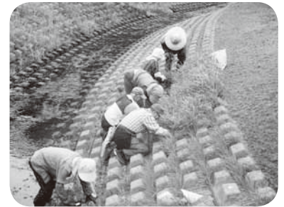
(三面ブロックの草取り)