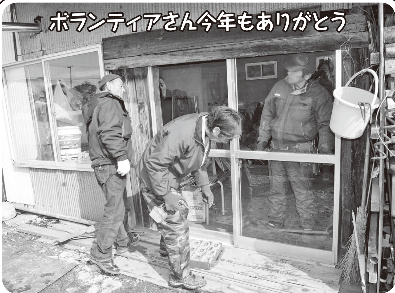
家屋・家財道具の補修サービス（浦幌町技能者協会）