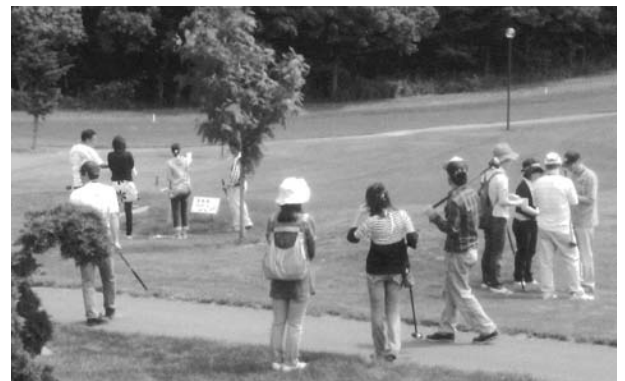
▲パークゴルフ交流会の様子 <事務局> 地域福祉課地域福祉係

相談員に直接相談することもできますので、事務局や相談員へお気軽にご連絡ください。