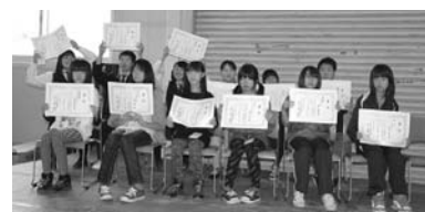
▲昨年度表彰式の様子

※応募された方のお名前・学校名・学年・団体名・活動内容を応募用紙に記された内容のまま印刷物・ホームページなどにより公表させていただくことがございますのでご了承下さい。なお、年齢・連絡先などの個人情報はご本人の了承なしに公表することは一切ありません。