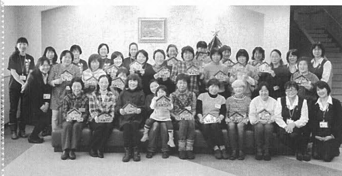
第2回フォローアップ研修会「みんなで作ったよー!」