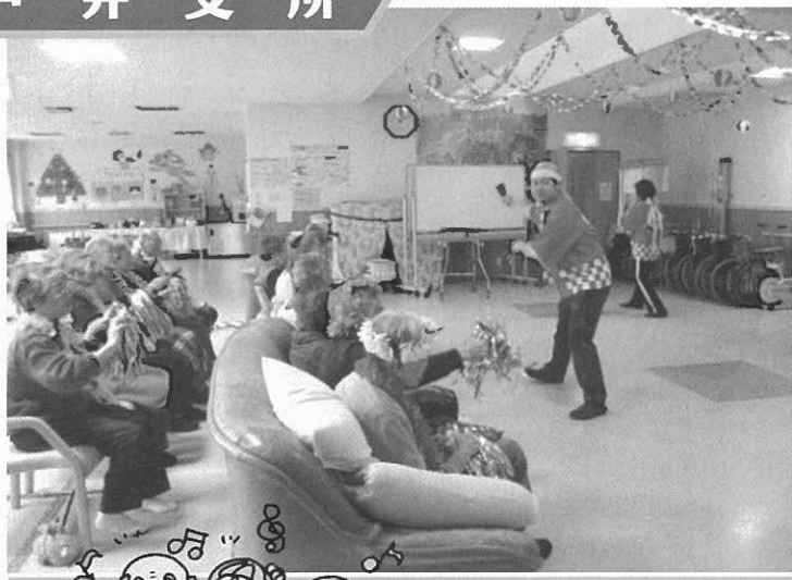
職員による「やさこい」披露の様子