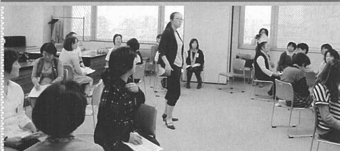
第1回フォローアップ研修会「みんな真剣です!!」