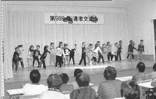
第9回 参達者交流会

当日は、148名の参加をいただき、ボランティア会員26名の協力のもと、江差追分会函館声徳会支部による民謡ショー、つじ保育園児による発表会、昼食会、カラオケ大会を催し、笑い声が絶えない会となりました。 なお、この事業は、恵山地区の皆様より募られた「赤い羽根共同募金」により開催されています。