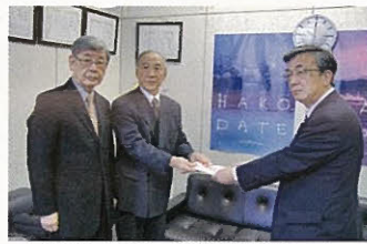
函館アマチュアダンス指導員会