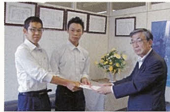
函館大学付属柏稜高等学校