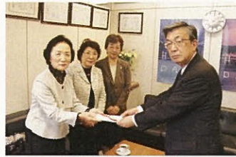
(財)小原流 函館支部