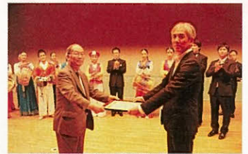
金剛山歌劇団函館公演実行委員会