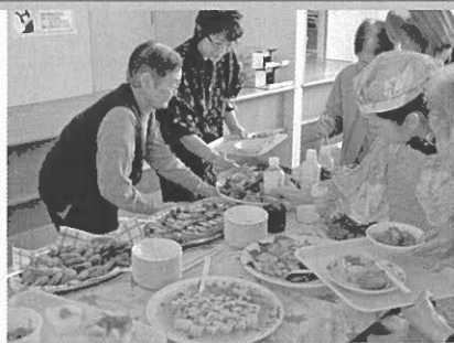
ランチバイキング