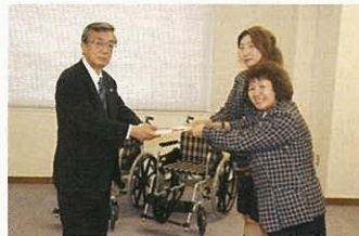
南北海道ヤクルト販売株式会社