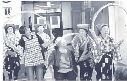
10月、南京玉すだれの慰問では入苑者も参加して。