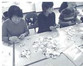
ボランティアクラブによる 切手の整理