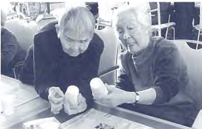
折り紙を貼り付けて顔をかいて、紙コップが可愛いお雛様に大変身！ 家に持って帰り、飾りました。