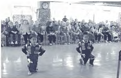
10月、和寒保育所年長児さんの可愛い慰問。お遊戯頑張りました。