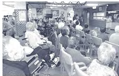
11月、たんぽぽの会の慰問ではのど自慢のカラオケとカッポレを！