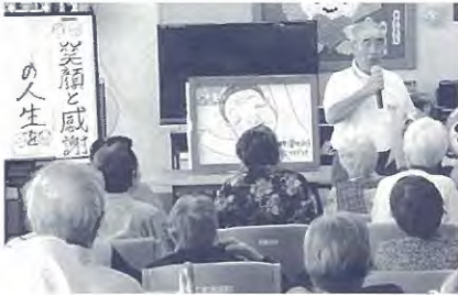
7月、人権擁護員さんによる講話と紙芝居。いいお話でした。

平成25年度も町内外からたくさんの方々の慰問をいただき、ありがとうございました。芳生苑に入苑している利用者も楽しみにしており、日々の活力につながっています。慰問の様子を写真でお知らせします。