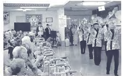
10月、三笠山大学伝承クラブによる大正琴や花笠音頭の披露。