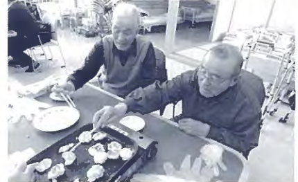
今日のおやつはみんなで丸めた芋団子。「もう、焼けたかなー」