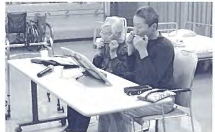
ハーモニカ同交会の慰問。曲に合わせて一緒に歌いました。