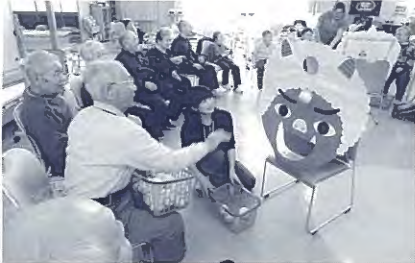
赤鬼・青鬼目掛けて「福は内！ 鬼は外！」職員手作りのゲームで午後の楽しいひとときです。