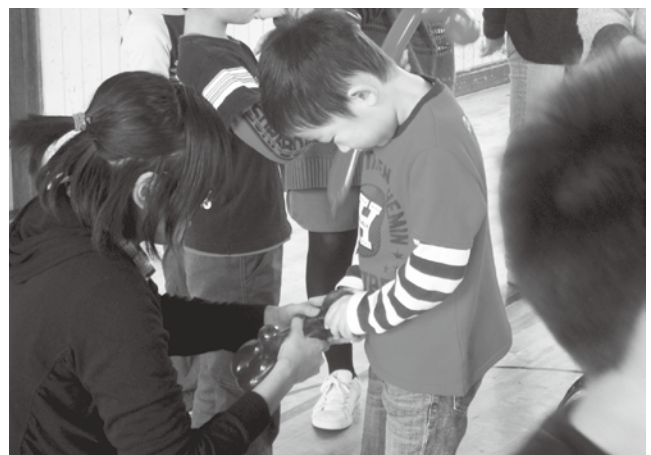
バルーンアートで児童館児童との交流