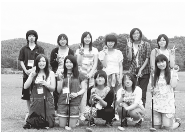
石巻市ほっとスペースの高校生と交流