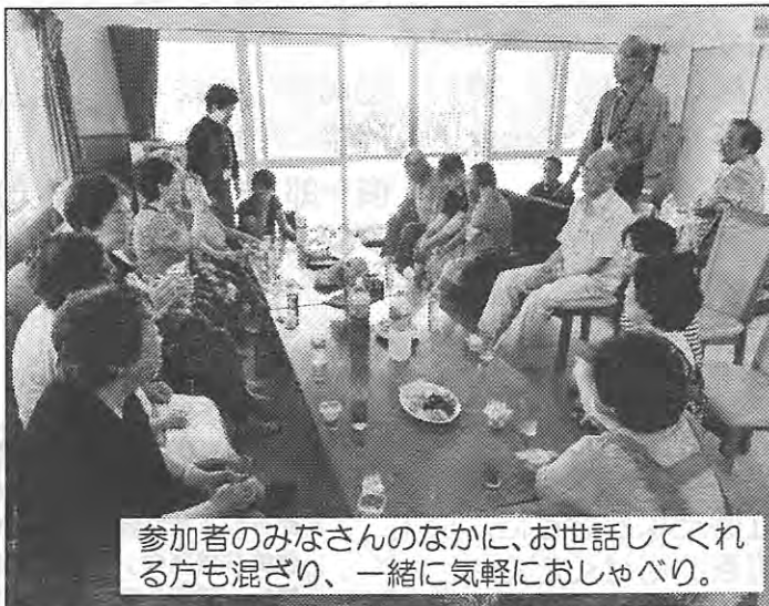
参加者のみなさんのなかに、お世話してくれる方も混ざり、一緒に気軽におしゃべり。

サロンの運営は自治会役員をはじめ、福祉委員さんや健康づくり推進委員、民生委員の方たちです。今月は21日（土）に開催する予定です。