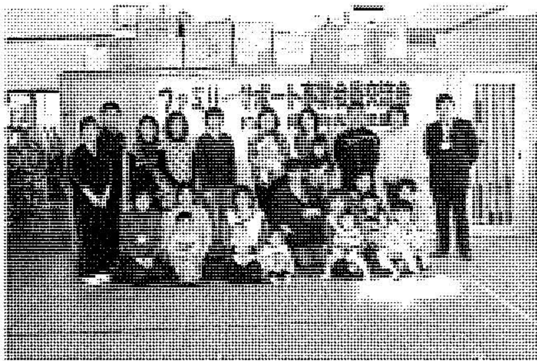
〔上〕参加者のみなさん、児童館職員のみなさんと集合写真を撮りました

今後も年に1度会員が一堂に会して交流を行い、子育てを一緒に共有することができるお手伝いを行う取り組みを進めます。