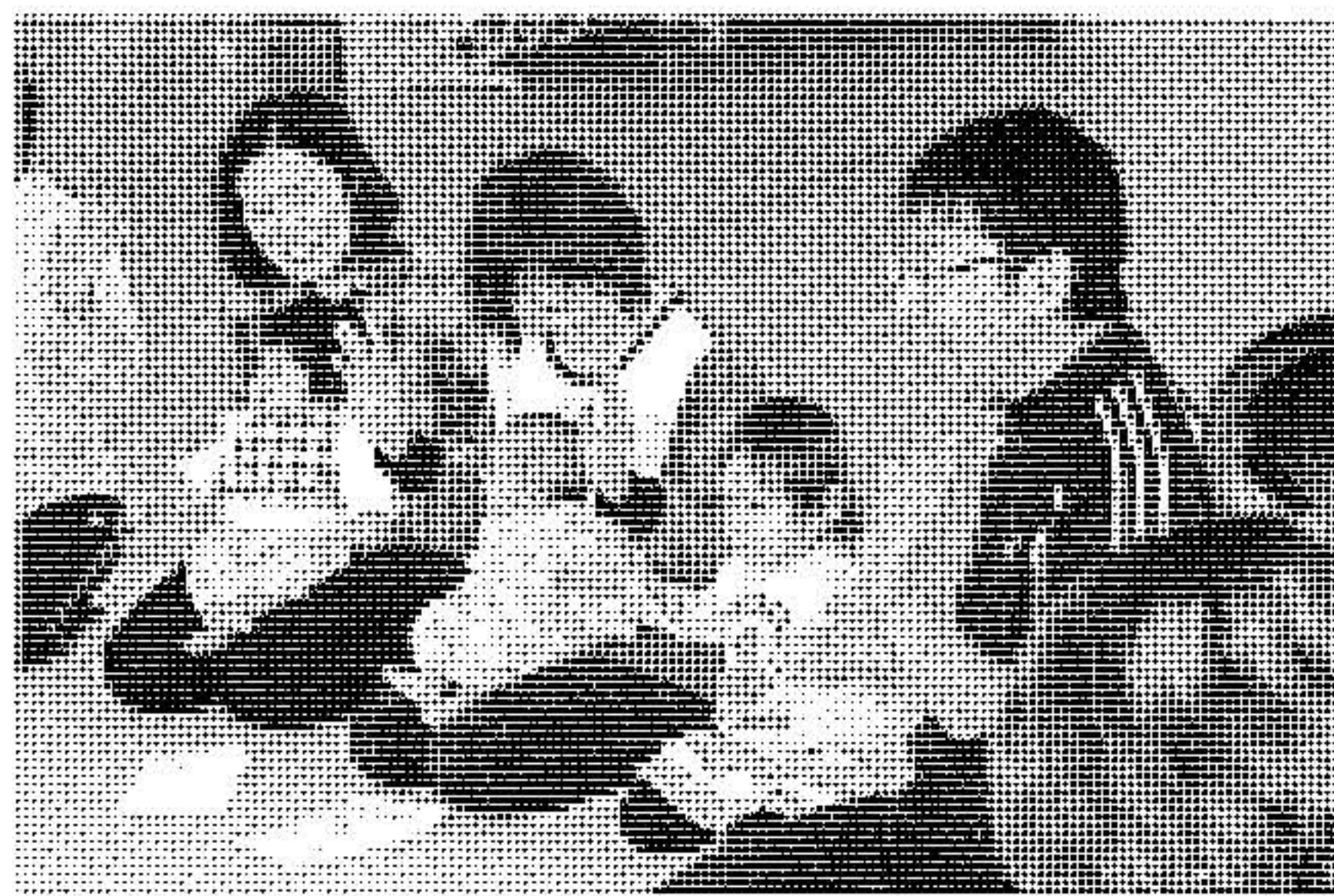
〔上〕手遊びの方法を教わりながら早速実践する参加者のみなさん